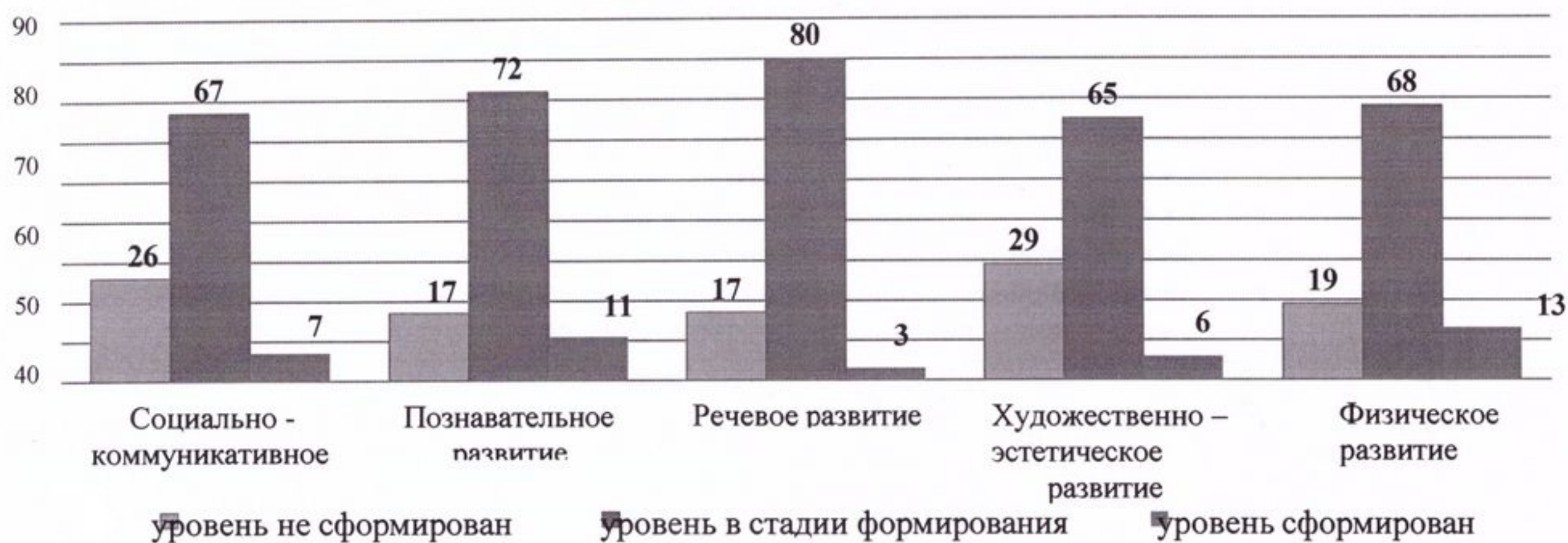
Итоговый (усредненный) результат освоения ООП ДО за 2023/24 учебный год по образовательным областям на конец года, в процентах, корпус №1